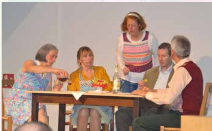
70iger Jahre – Nachbarschaftsbesuche