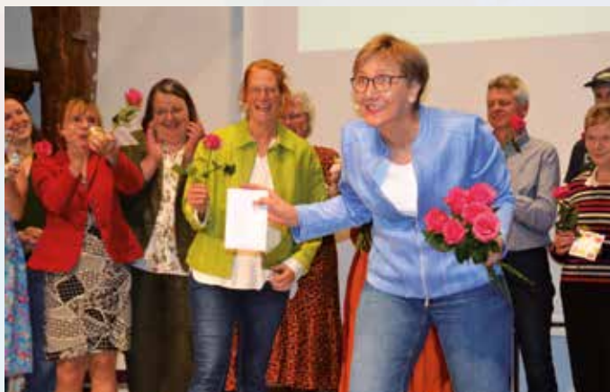
Abschluss und Begeisterung des Publikums